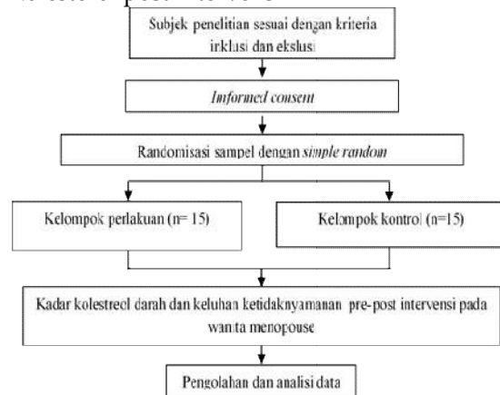
Gambar 2. Bagan alir penelitian

dimana R: Subjek, X: jus bengkoang, A : Kelompok perlakuan, Y : susu kedelai, B : Kelompok kontrol, O1: Pengukuran kadar kolesterol pre intervensi, O2: Pengukuran kadar kolesterol post intervensi